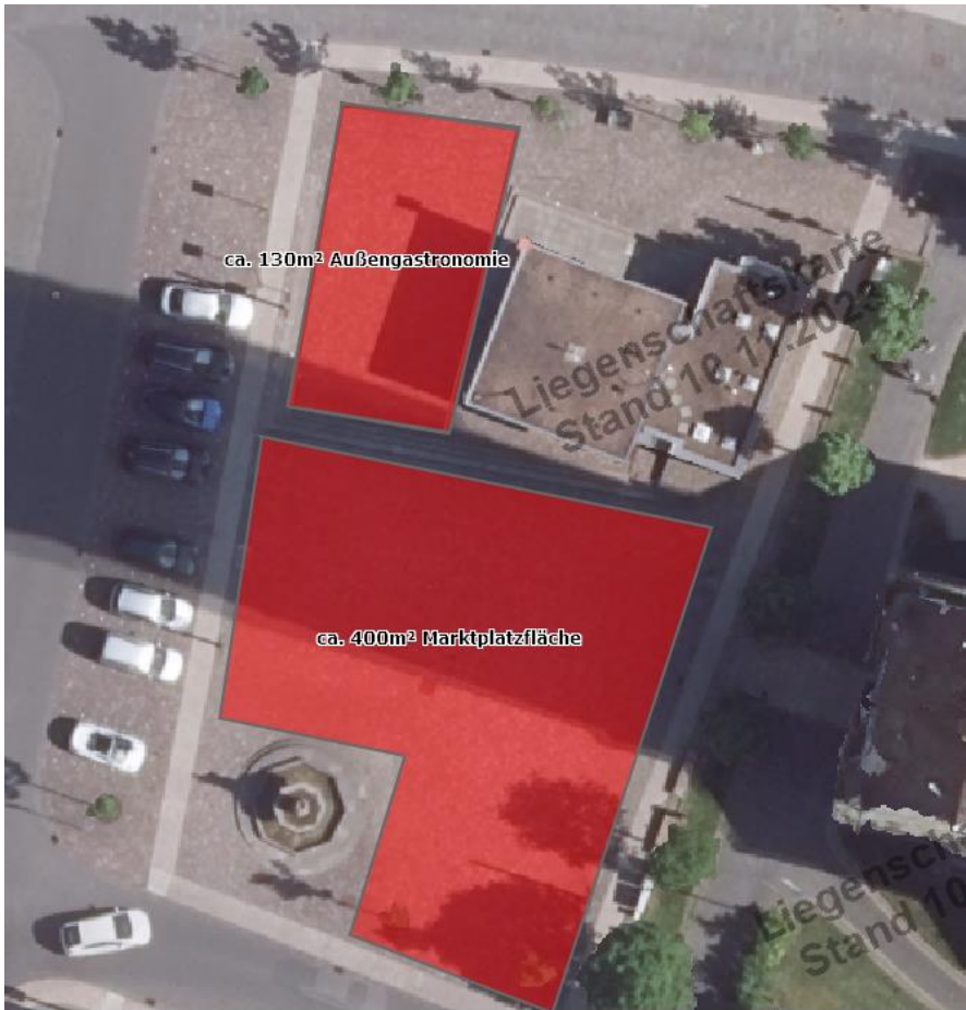
Nutzbare Flächen für Außengastronomie: Direkt vor dem Infocenter.