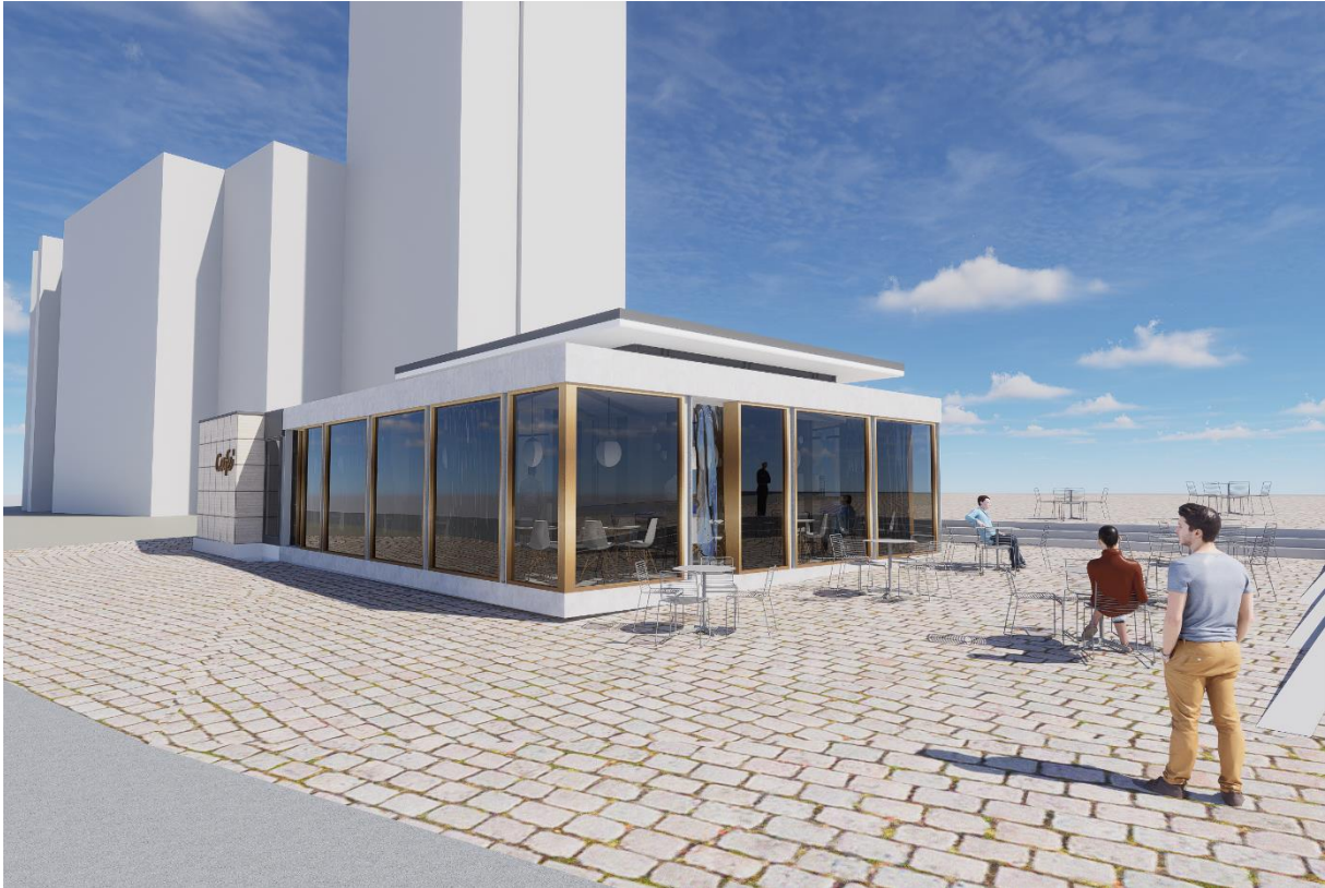
Visualisierung geplanter Ausbau auf ca. 105qm.