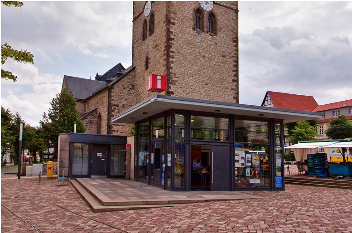
Immobilie auf dem Neustadtmarktplatz: Derzeit als Infocenter in Nutzung. Links anliegenden der Eingang zu den öffentlichen Toilettenanlagen.