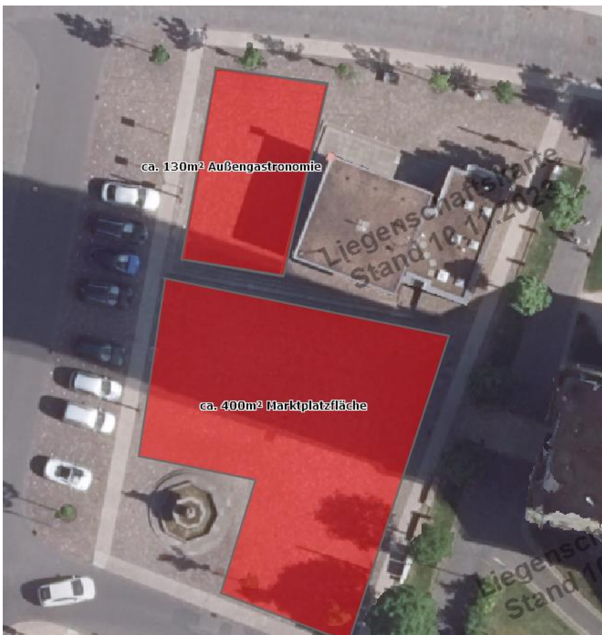
Nutzbare Flächen für Außengastronomie: Direkt vor dem Infocenter.